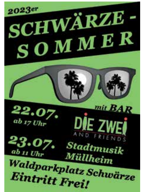
Plakat Schwärze-Sommer '23

Dem Wochende schließt sich am Montag das traditionelle Handwerker-Essen zur Mittagszeit an, zu dem wir die umliegenden Betriebe herzlich einladen.